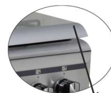
Tapa cristal con PERFIL FRONTAL ALUMINIO